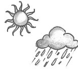
Baustein für jedes Wetter